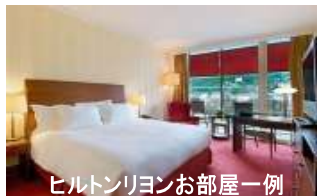
ヒルトンリヨンお部屋一例

シラ開催期間中はリヨンの街も活気付きます。世界中からたくさんの訪問者を抱えたリヨンのホテルも大変混みあいホテルの確保も大変な状況です。 今回は安心のヒルトンリヨン指定とさせていただきます。定評のホテル滞在を十分お楽しみ下さい。 ツアー代金は2名一室設定です。 お一人でのご利用は追加代金 ¥85,000 が必要となります。